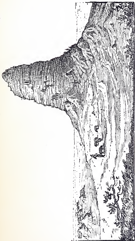
VUE DU NEMROUDE-TAPESSI.

(Dessin de O'Collaghan, d'après un lavis de ROËSSEAU).